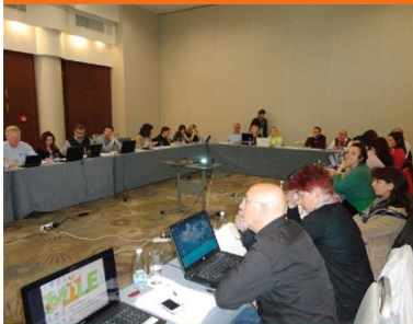
Sofia, 24-25 April 2014