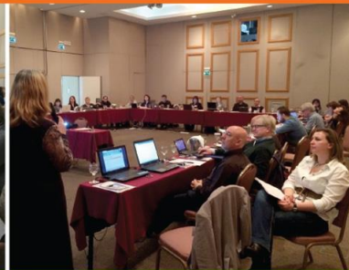
Athens, 26-27 February 2015