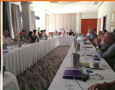
Malta, 23-24 October 2014