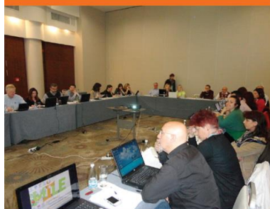
Sofia, 24-25 April 2014