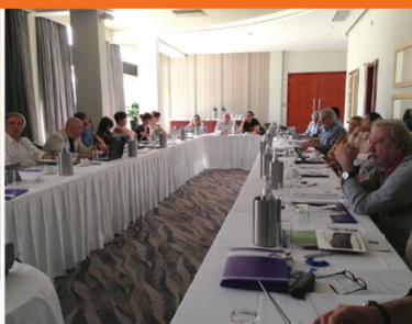
Malta, 23-24 October 2014