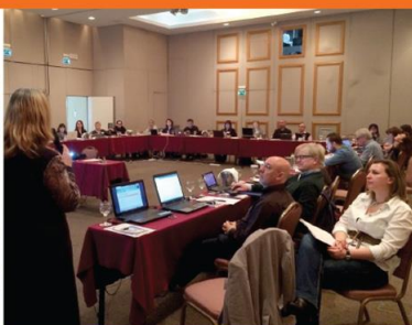
Athens, 26-27 February 2015