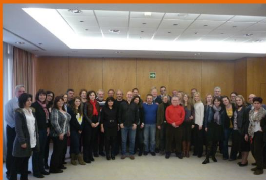
Kick-off meeting in Valencia, Spain